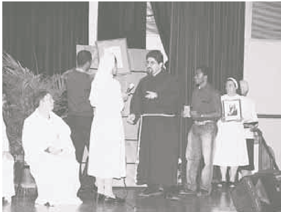
Religiosos y religiosas durante la Misa en el Colegio Marista.

Les invito a que lean el capítulo II de la Novo Millennio Ineunte: Un Rostro para Contemplar, en el que pueden encontrar pistas estupendas y atinadas. Insisto, no es cuestión de conocer las Escrituras, de saberlas citar de memoria,