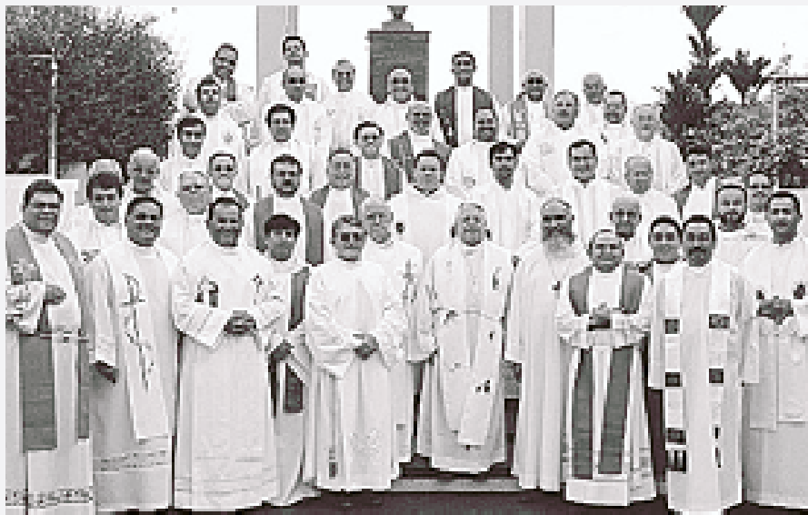
Grupo de sacerdotes que participaron del retiro.

Este año, en el cual el Santo Padre ha exhortado a los fieles cristianos el que vivamos mas unidos al Sacramento de la Eucaristía, nosotros los sacerdotes y obispos estamos llamados a ser reflejo vivo del amor a Dios en la Eucaristía.