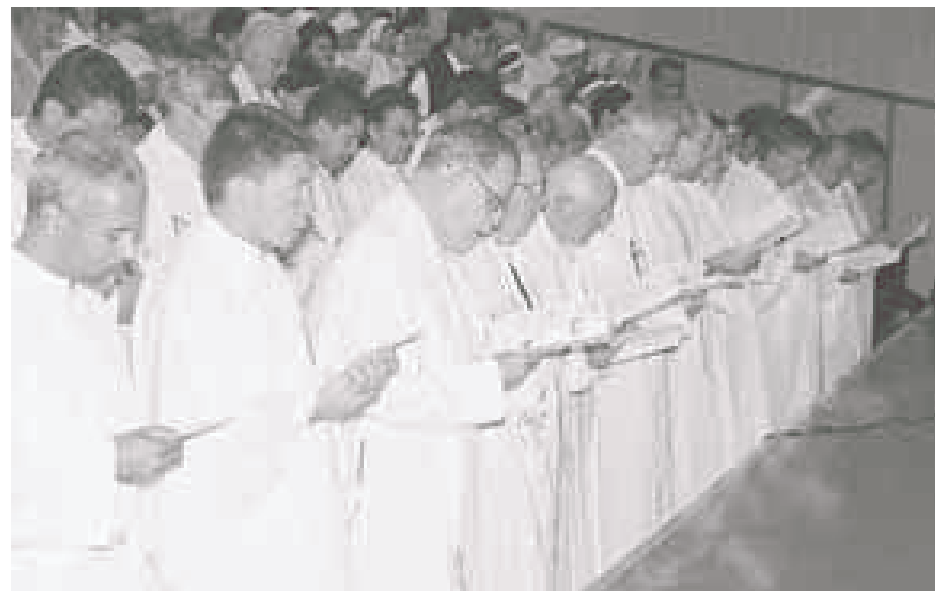
"...llamados a propagar el fuego del amor que vino a traer Cristo a la tierra."

Dios es amor. El mundo necesita amor. Y los religiosos como testigos del amor están llamados a propagar el fuego del amor que vino a traer Cristo a la tierra.