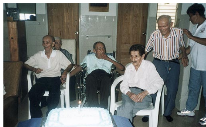
Vicentinos compartiendo y llevando alegría a los ancianos.

Fundada por el beato Federico Ozanam en 1833, junto a siete compañeros estudiantes de la Universidad de París. Adoptó el nombre de san Vicente de Paúl, el santo de los pobres , como patrón inspirador por sus virtudes de caridad hacia los necesitados. La Sociedad está presente en 132 países, con una membresía de 950,000 voluntarios vicentinos. “El carisma de la Sociedad no es otra cosa