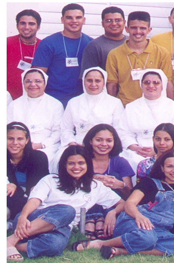
Acampada de jóvenes.

Las raíces de JMV se sitúan en el año 1830, en el mensaje de la primera aparición de la Virgen a la novicia de las HC, Catalina Labouré. La aprobación inicial del Papa Pío IX fue en 1847. JMV es un proyecto cristiano con el carisma vicentino, que opta por una pastoral juvenil en línea catecumenal que pretende: “que los jóvenes lleguen a una maduración integral de la fe, buscando que puedan alcanzar, desde la formación, la celebración y el servicio, la conversión que los identifique en el mundo como testigos de Jesús de Nazaret, el evangelizador de los pobres” .