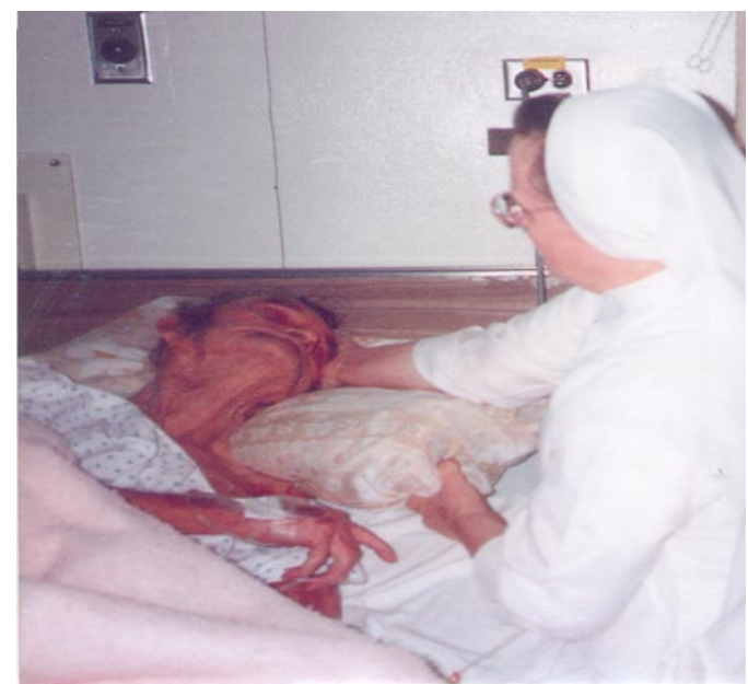
Asistiendo a los ancianos con amor.

Fundadas por san Vicente de Paúl y santa Luisa de Marillac en el 1633, en París (Francia). El fin principal para el que fueron fundadas fue el de servir a Jesucristo en la persona de los pobres. El escudo de las HC lleva en torno esta leyenda: “La caridad de Jesús crucificado nos apremia” . Esto quiere decir que la caridad de Jesucristo crucificado anima e inflama el corazón de sus hijas y las apremia a acudir al servicio de todas las miserias. Al presente hay 25,000 Hijas de la Caridad repartidas en el mundo.