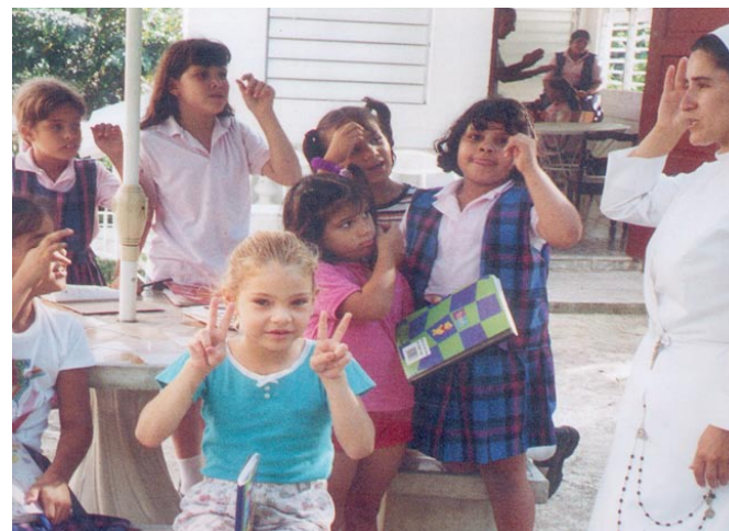
Catequisis de niños.

Llegan a Puerto Rico en el 1863 y rendimos servicio a los pobres en los siguientes lugares: Hospitales (San Germán, Ponce y Hato Rey), Colegios (Mayagüez, Ponce, Arecibo, Río Piedras, Santurce, Manatí, y San Juan), Hogares de Ancianos (Arecibo y Vega Baja), Centros diurnos