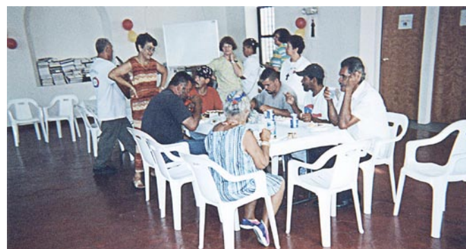
Nuestras voluntarias hacen un alto para el diálogo necesario y compartir durante un almuerzo con un grupo de hermanos sin techo. (Fotos suministradas)

Es la primera fundación de san Vicente de Paúl establecida en el 1617, en Chantillon-Dombes (Francia). Para san Vicente la caridad, para ser efectiva, tiene que estar bien organizada; es por esto que nuestra asociación se fundamenta en una fuerte organización. Nuestro fundador decía que los pobres han sufrido muchas veces, más por la falta de orden que por la falta de personas caritativas . Actualmente la AIC está presente en 56 países, con 260,000 voluntarios activos y