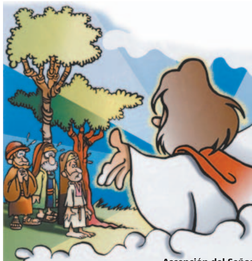
Ascensión del Señor

¿Recuerdan cuando hablamos de la Ascensión de Jesús al cielo? Eso ocurrió frente a sus discípulos. Ellos recibieron la promesa de Jesús de que en pocos días enviaría la fuerza del Espíritu Santo, que les acompañaría siempre. Aunque no entendieron bien del todo, los discípulos y María Santísima esperaron y confiaron. Siempre se reunían en el mismo lugar para orar y compartir.