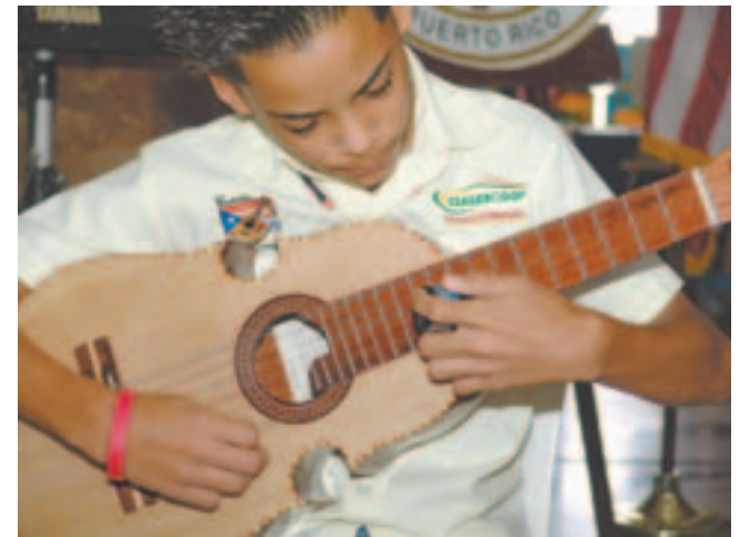
Integrante de la Rondalla.

“La actividad se hizo bajo el amor de Dios”