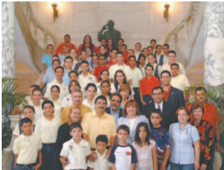
Participantes y dirigentes de la exhibición.