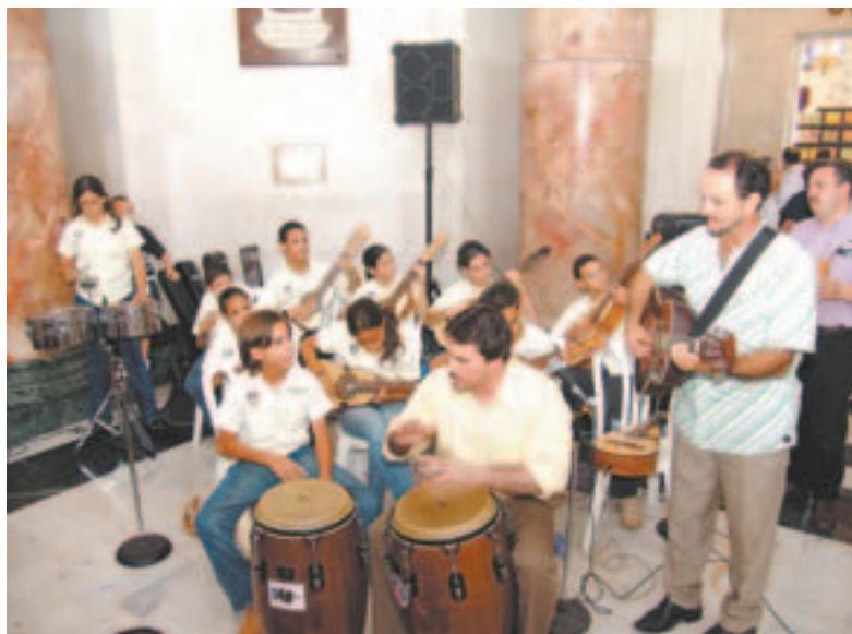
La Rondalla Cuerda Serranía deleitó a todos.