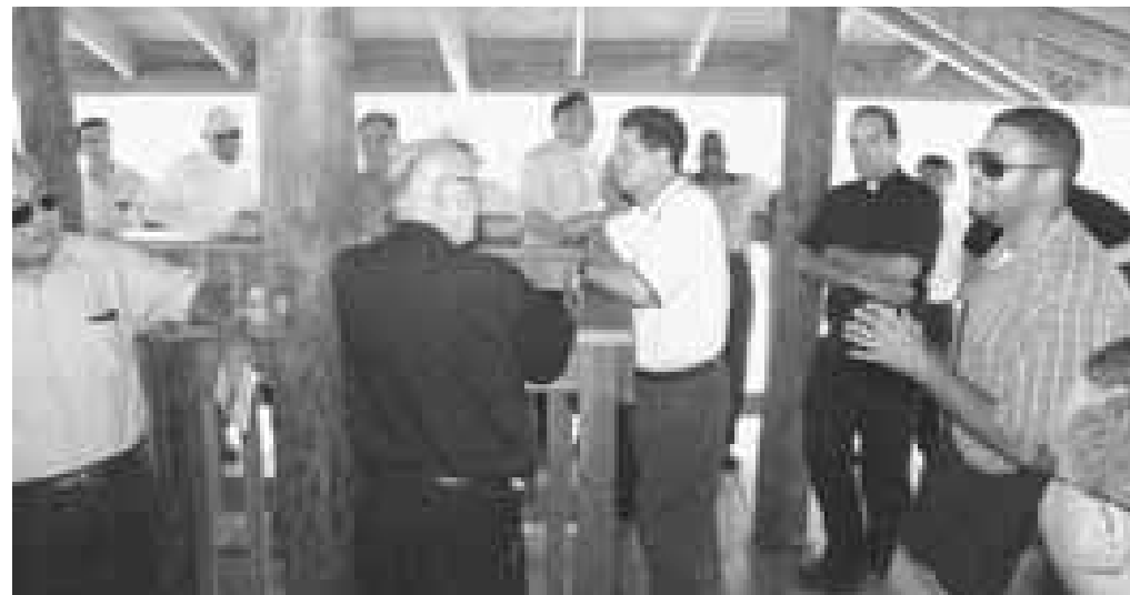
Sacerdotes reciben una orientación sobre las Salinas de Cabo Rojo.

Verdaderamente no hay nada más hermoso que haberse dejado sorprender por Cristo. Viviendo fielmente en comunión con el carisma y ministerio petrino, se redescubre esta realidad de nuestra vocación pastoral como fuente de gozo pascual de Cristo en nosotros y en los demás. "Nada más bello que conocerle y comunicar a los otros la amistad con él. La tarea del pastor, del pescador de hombres, puede parecer a veces gravosa. Pero es gozosa y grande, porque en definitiva es un