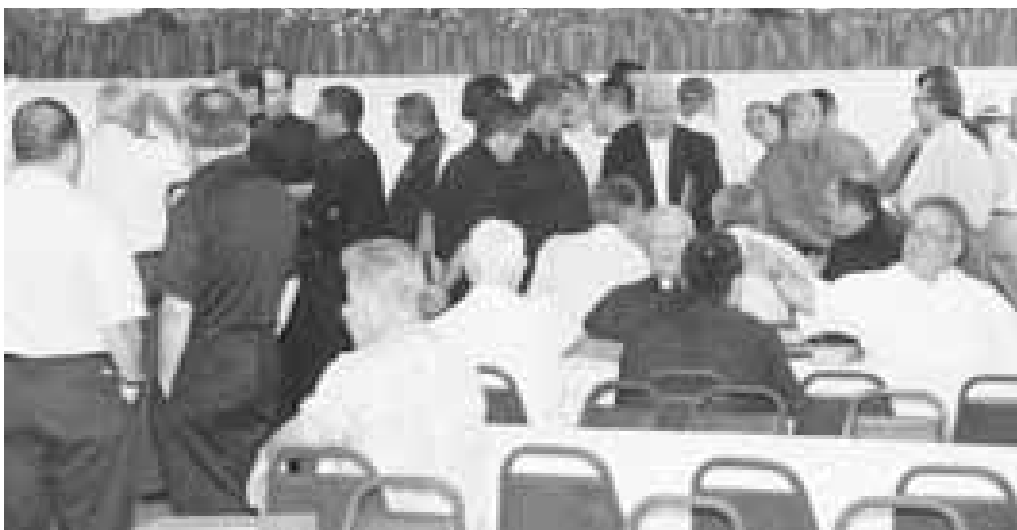
Sacerdotes comparten un desayuno de bienvenida a la actividad