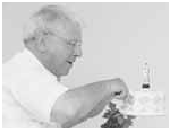
Monseñor Félix Lázaro parte el pastel conmemorativo del quinto encuentro.

los sacerdotes y los cristianos olvidamos el camino de la cruz, hablando simplemente de la muerte y resurrección, sin mencionar que la muerte es el final de un recorrido largo y penoso: el camino de la cruz.