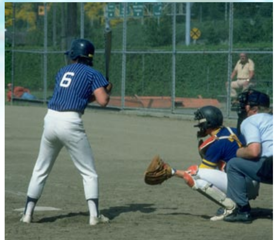
Los deportes fomentan la socialización y el desarrollo de actitudes competitivas sanas.

“Para ser una persona integral, hay que desarrollarse a distintos niveles. No sólo importan los factores académicos y emocionales, ya que la parte física puede afectar, positiva o negativamente, otras facetas de la vida, también.”