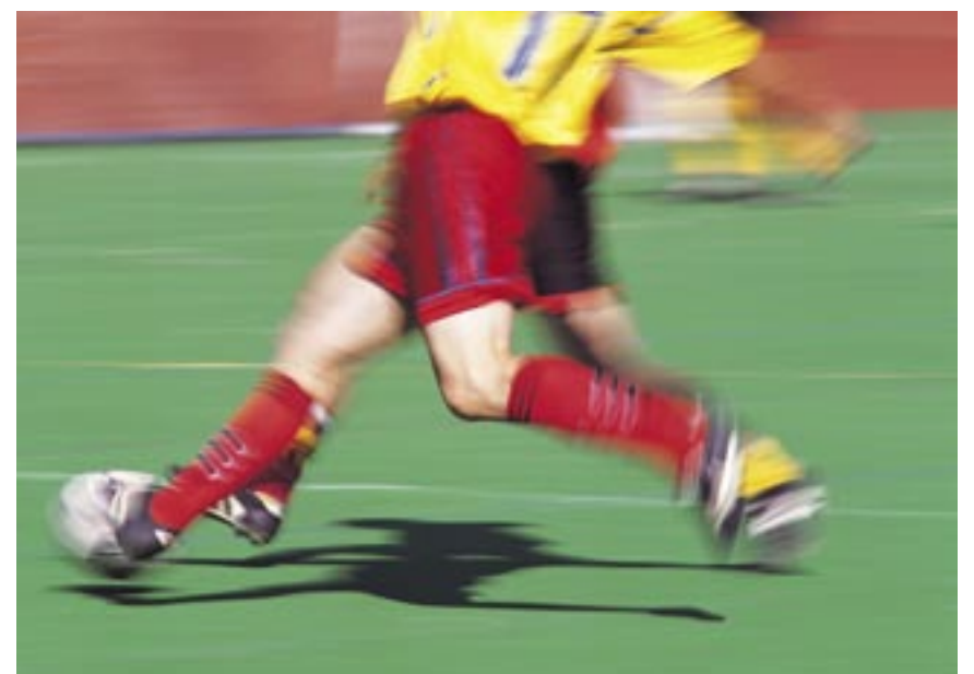
Es importante que los niños sean encaminados a participar de actividades deportivas, dentro y fuera de la casa.

Así que, si bien es importante desarrollar el potencial máximo de niños y jóvenes en actividades educativas, religiosas y familiares, no podemos perder de perspectiva que la buena condición física, la competencia sana y la interacción con otros que disfruten del deporte también es parte vital de la experiencia de vida de cada individuo.