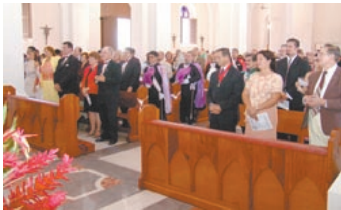
Los Caballeros de Colón, amigos y familiares tomaron misa en la Parroquia Dulce Nombre de Jesús, en Humacao.

Al finalizar la misa, se llevó a cabo la juramentación de los Diputados de Distritos, Director de Matrícula, Director de Programa y los demás Funcionarios del Consejo de Estado, en las instalaciones del Consejo Padre Agapito Iriberry, en el mismo pueblo.