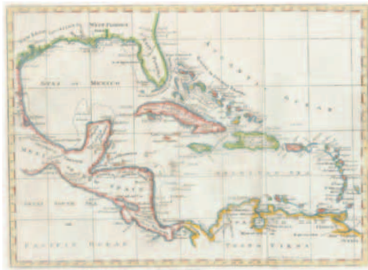
Este mapa muestra los anejos territoriales de la diócesis de San Juan Bautista de Puerto Rico desde San Juan hasta la región de Cumaná en la zona del Orinoco y el Amazonas en Venezuela. El período histórico que el mapa expone va desde 1519 hasta 1790. El mapa es propiedad del Dr. Manuel Alvarado Morales.

(El autor es historiador y profesor del Centro de Estudios Avanzados de Puerto Rico y el Caribe)