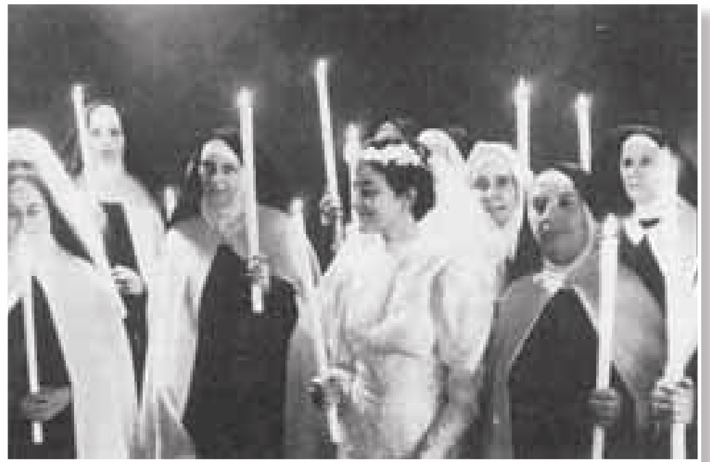
Escena de la profesión de Teresa en Thérèse .

de los de Robert Bresson, tantas veces premiado por la OCIC, por el método que utiliza para presentar a través de imágenes y sonidos aspectos y sucesos de la vida de la Santa. Le falta, sin embargo, la complejidad psicológica tan