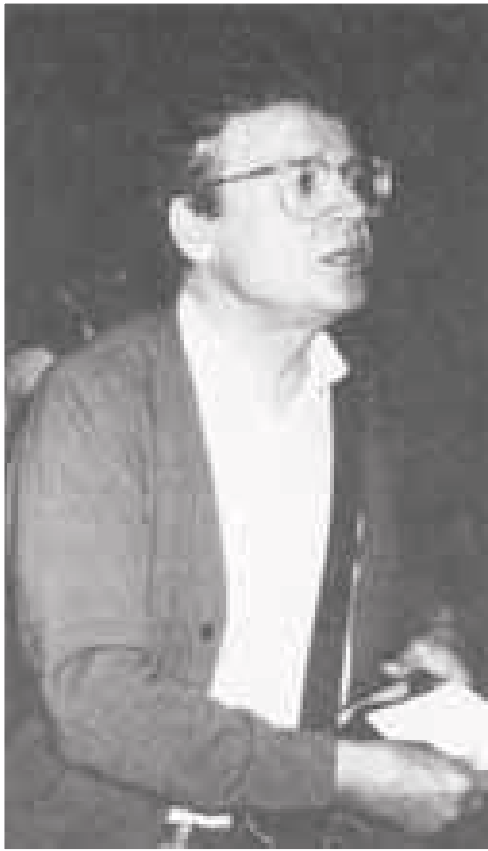
Alain Cavalier, director de la otra Teresa

toma lugar poco antes de su muerte, víctima de la tuberculosis. La última parte de la cinta se concentra en el proceso de su enfermedad y muerte.