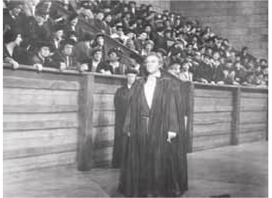
Paul Scofield personifica a Santo Tomás Moro en A Man for All Seasons.

Las procedencias nacionales también juegan su papel. Así San Felipe de Jesús, santo mexicano ha viajado a la pantalla a través de la película mexicana de ese mismo título. Santa Rosa de Lima y San Martín de Porres cuentan también con su núcleo de películas. La santa limeña fue la razón de ser de Rosa de América , cinta argentina dirigida por Alberto de Zavalía que llevaba a su esposa, la actriz Delia Garcés en el rol titular. Años más tarde otra