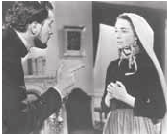
Jennifer Jones como Bernardita en The Song of Bernardette .

El cine, nacido tan tarde en la evolución creativa de la humanidad (aparece por primera vez en la modalidad del cinematógrafo en las postrimerías del año 1895 y sólo se generaliza y se populariza a través de las películas de argumento a comienzos del siglo XX), también se ha acercado a los santos para convertirlos en sujetos de algunos de sus ofrecimientos. Lo que acontece es que el cine por razón misma de ese nacimiento tardío se impo-