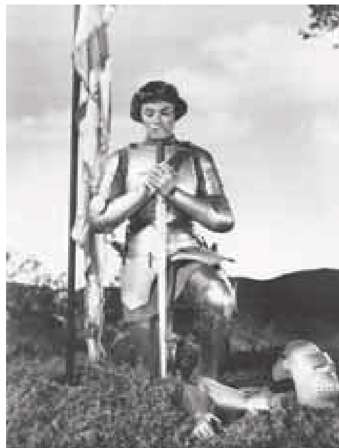
Ingrid Bergman interpreta a Juana de Arco en Joan of Arc .