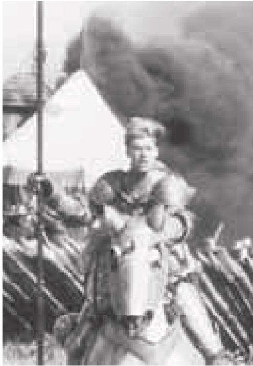
Milla Jovovich en The Messenger: the Story of Joan of Arc .

Santos menos conocidos como San José de Cupertino, en cuya vida se inspira The Reluctant Saint , filme que lleva a Maximilian Schell en el papel principal o Santo Tomás Moro, canciller de Enrique VIII de Inglaterra, se han