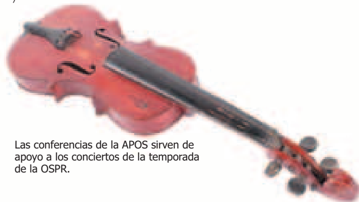
Las conferencias de la APOS sirven de apoyo a los conciertos de la temporada de la OSPR.

No se pierda esta excelente actividad cultural. Para más información llame al 787-725-3388 / 787-769-8595 / 787-5311 y 787-726-3291.