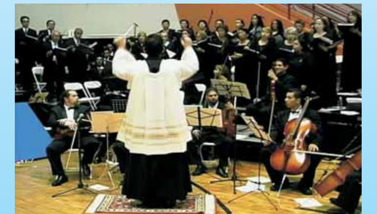
El Coro de la Catedral de Mayagüez y la orquesta.

Ruego a Dios para que los frutos de este año de la Eucaristía sigan enriqueciendo al Clero, a las Religiosas y a todos los fieles que peregrinan en esta diócesis para fortalecer su compromiso cristiano y su testimonio valiente de la acción divina en el mundo de hoy. En esta circunstancia, el Papa confía bajo la protección de la Virgen de la Monserrate, al Pueblo de Dios de esta querida diócesis, invitando a todos a perseverar en su fidelidad al Evangelio, construyendo sobre ello una comunidad orante y unida. Con estos deseos, y como signo de abundantes dones divinos, el Santo Padre imparte a los participantes en tan solemne celebración en el Palacio de los Deportes la implorada Bendición Apostólica extendida también a los enfermos y a las Religiosas del Monasterio de Santa María del Monte Carmelo. Unido a los sentimientos del Sumo Pontífice, me es grato renovar, Señor Obispo, la seguridad de mi consideración y estima en Cristo. A. Card. Sodano Card. Angelo Sodano Secretario de Estado de Su Santidad