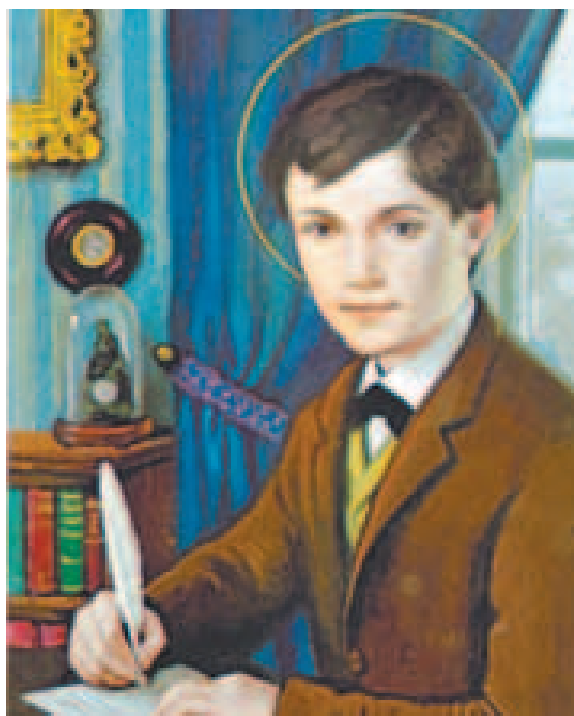
Santo Domingo Savio

El día 6 de mayo es la fiesta de Santo Domingo Savio. Sus padres eran personas muy pobres, apenas podían mantener la familia. Pero de ese hogar humilde nació un santo. El papá era mecánico y la mamá costurera y como muchos niños en nuestro