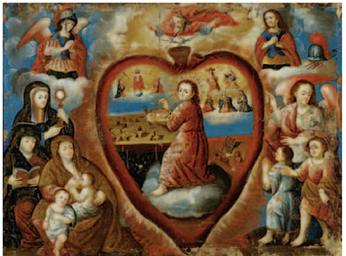
Niño Cristo Pintando

En un principio, las pinturas al óleo de Suramérica fueron provistas por artistas italianos, españoles y flamencos. Pero pronto los europeos fueron superados en número por los artistas nativos que hábilmente decoraron las iglesias y las edificaciones públicas. También se produjeron innumerables pinturas de caballete, casi siempre en grandes talleres con varios artistas que aportaban sus habilidades especializadas a la obra terminada. Varias de las pinturas de la colección exhibida conservan sus marcos originales con toda la riqueza de la talla, que parte de la tradición de los talleres.