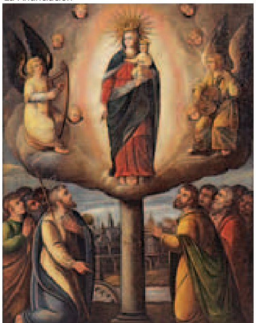
Nuestra Señora del Pilar

Ya con el verano a medias, las opciones para ocupar el tiempo libre parecen escasear por momentos. Sin embargo, siempre quedan muchas por descubrir, como visitar el museo, por ejemplo.