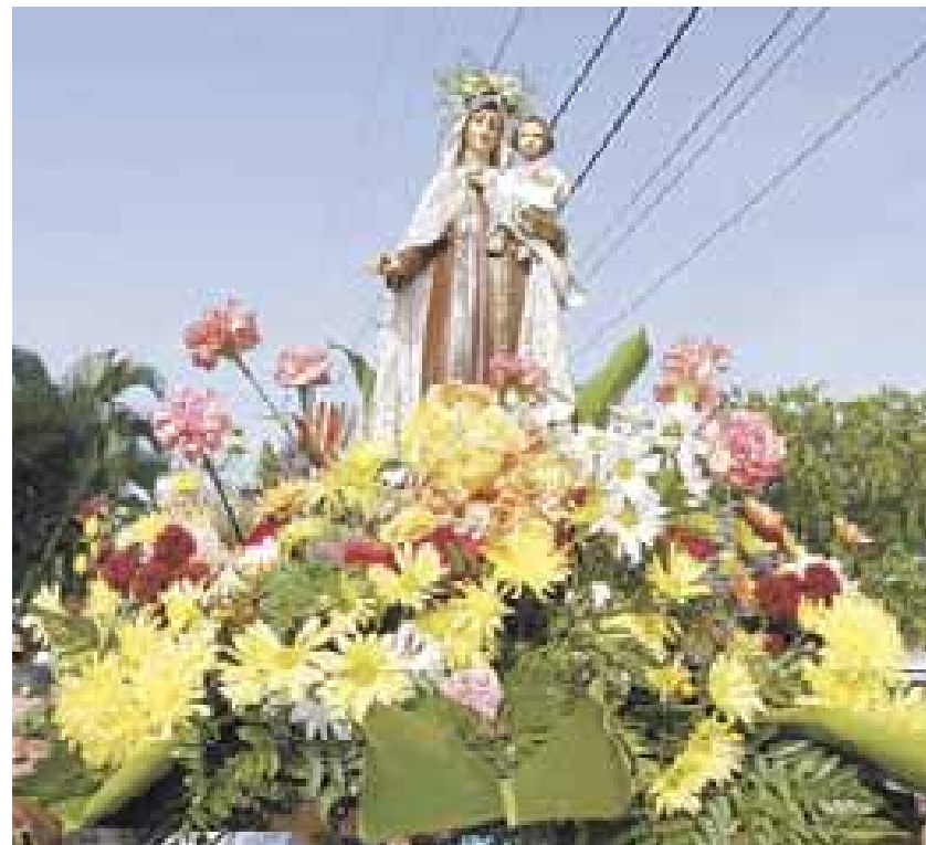
Recorrido de la Virgen en la Villa de los Pescadores en Naguabo, 2006.

Lorenzo se destacó como sacerdote y predicador y logró