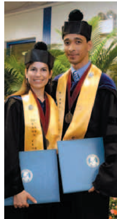
Los esposos obtuvieron sus grados Juris Doctor en la Escuela de Derecho de la PUCPR. (Eric Quiñones)

Antes de concluir, el licenciado aconsejó a los jóvenes a “establecerse metas, y por