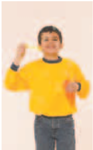
Señor, disfruto cada día, gracias a Tí.

Muchos años atrás, aquellos hombres y mujeres que respondieron a ese llamado de Dios, y que con ellos nacieron diferentes congregaciones, con la aprobación del Santo Padre en Roma, son santos y santas que ustedes y yo conocemos. ¿Recuerdan el nombre de Francisco de Asís? ¿Clara de Asís? ¿Don Bosco? ¡Sus vidas son de verdadera aventura!