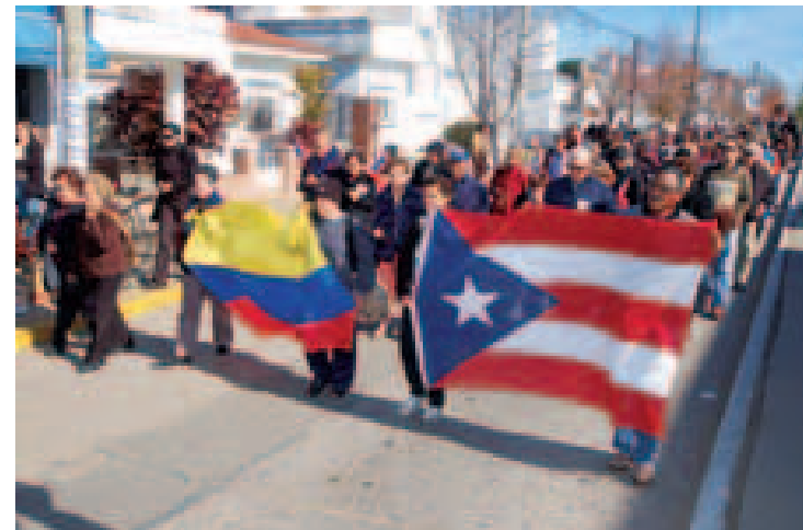
Procesión multicultural.

Luego de casi 10 días en ruta con la compañía de la imagen de Nuestra Señora de la Providencia (tallada en Ecuador) y después visitar varios santuarios marianos y la Abadía Benedictina, llegamos a la ciudad de Coronda, conocida como la Capital Nacional de la Fresa, Provincia de Santa Fe. ¡Qué alegría y entusiasmo! La emoción y la cálida bienvenida de los corondinos a la entrada de su ciudad disiparon el frío y el viento presente aquella