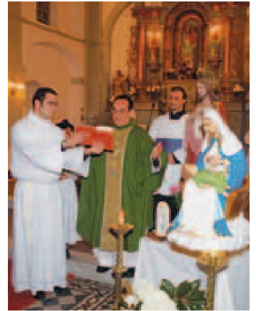
Instalación de la Virgen.

Fieles católicos de nuestra Isla y la República Colombiana se congregaron en peregrinación para promover los lazos católicos culturales de la República Argentina, el Caribe y Suramérica. El itinerario del viaje, realizado en junio, contó con la visita a diez ciudades y dos países: (en Argentina) Buenos Aires, Luján, Iratí, San Antonio de Areco, Iguazú, Puerto Rico (cerca de las cataratas de Iguazú), Santa Fe, San Carlos, Coronda, Rosario, San Nicolás y la República Oriental de Uruguay.