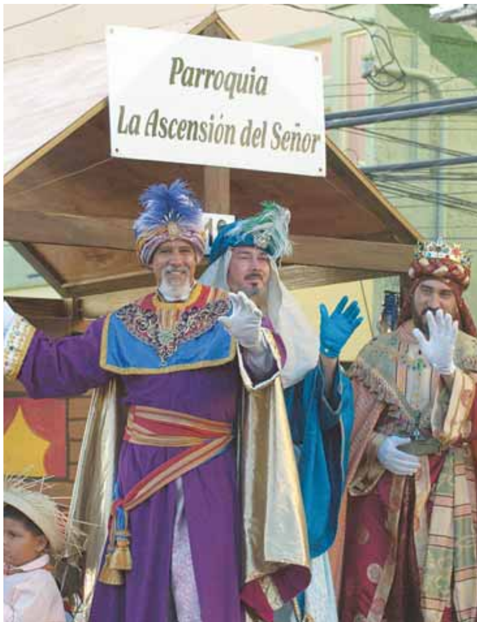
Los Reyes Magos estuvieron en la actividad. (Eric Quiñones)