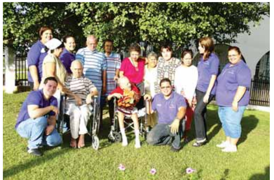
El Hogar María del Carmen atiende ancianos y deambulantes. (Ricardo Rivera)