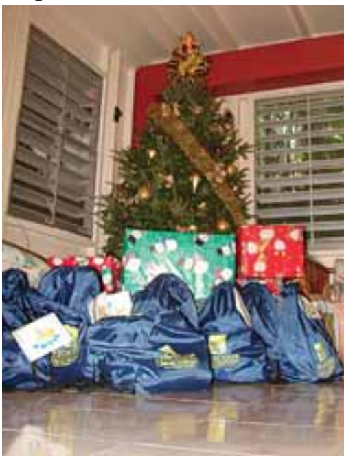
El Visitante y Católica Radio llevaron regalos a las niñas del Hogar Rafaela Ybarra. (Ricardo Rivera)