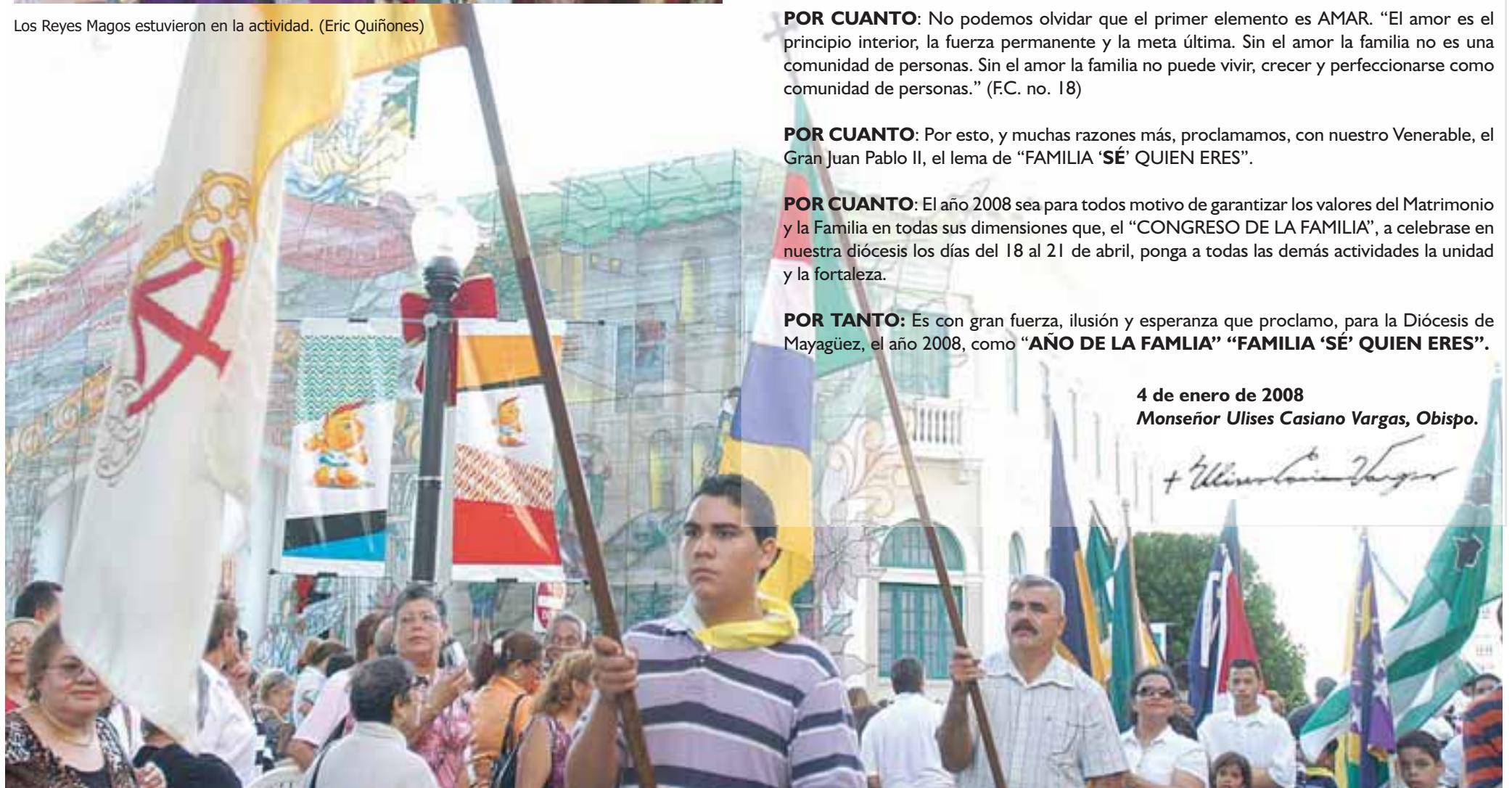
Cientos de asistentes se dieron cita en la Plaza Colón para el evento. (Eric Quiñones)