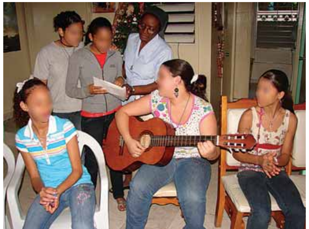
Las niñas y jóvenes cantaron para los representantes del Periódico y la estación radial. (Ricardo Rivera)