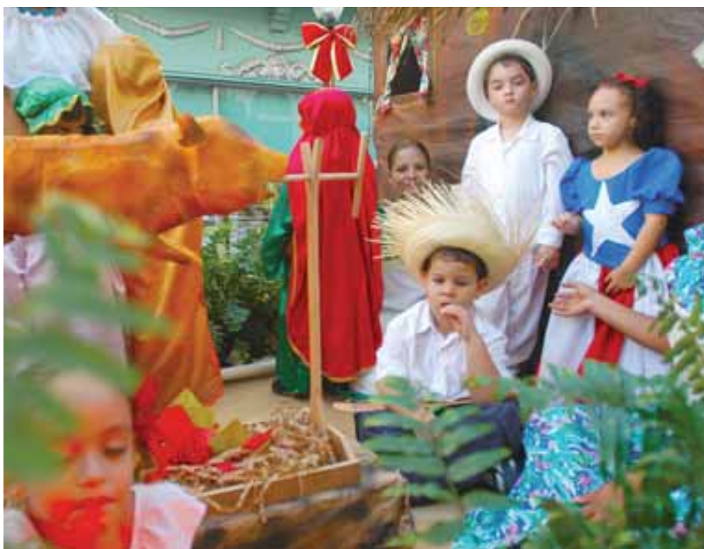
El 2007 fue el Año del Niño. (Eric Quiñones)