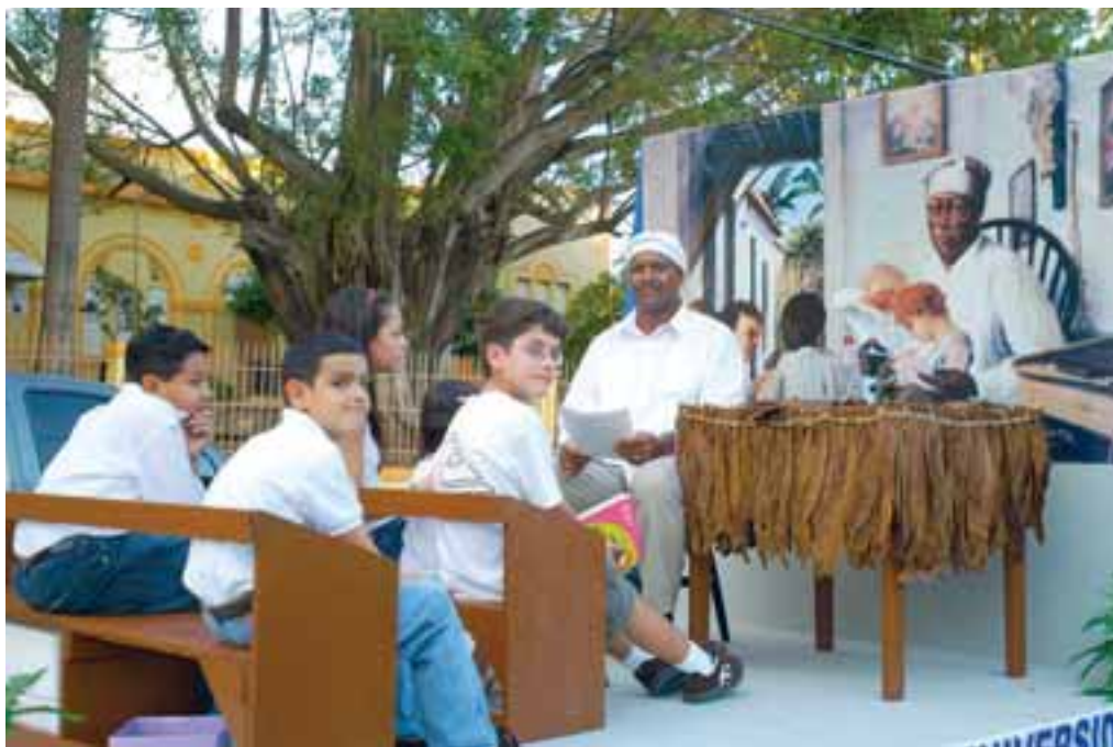
Las 28 parroquias de la Diócesis representaron diversos temas. (Eric Quiñones)